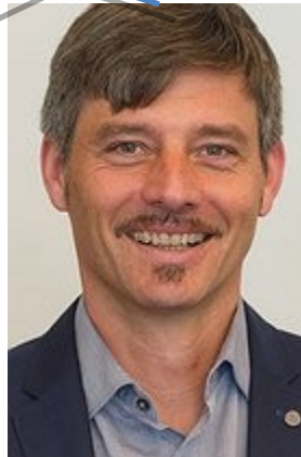
Aribio Asam P-Verantwortung